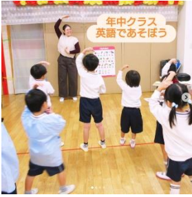
tokumochikg 2025.11.06 (木) 🎉👉👈 年中クラス「英語であそぼう」 本日のお題は数字 1〜20 キラキラ星 ✨ How Many Star 🌟 10個のキラキラ星をカウントしました👏 1〜20の数字カードを、ランダムにひいて並べる👉 ポディランゲージでアルファベット 今日の締めくくりは、How Old Are You ? 4歳ですか？ 5歳になりましたか？ でした👏