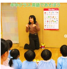
tokumochikg 2026.01.15 (木) 🎵👉👈 年中クラス 英語であそぼう 🎵〜英語で挨拶〜英語の楽曲に合わせて身体を動かし〜Happy・Sad・Hungry・Angry・Sleepy 〜A B C アルファベットカードを使った英語発音