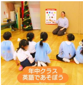
tokumochikg 2025.12.04 (木) 🎵👉👈 年中クラス〜英語であそぼう 🎵 テーマは「かたち」👉 10の星 Ten Star〜アルファベットの歌〜Big A〜Big Z までの発音と、ランダムに配られたカードをAから順番に並べ替え👉 かたち釣りゲーム👉 サークル○〜トライアングル△〜正方形□〜ハート♥〜ダイヤモンド◆〜スター★