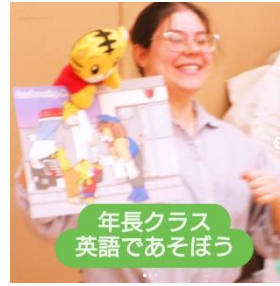
tokumochikg 2025.12.04 (木) 🏠👉👈 年長クラス〜英語であそぼう 🎵 He is a ~ She is a ~ で、絵カードの職業を英語で表現しました👏 大工さん〜Carpenter 野球選手〜Baseball Player 医師〜Doctor などなど ロンドン橋 London Bridge の曲から、お辞儀の仕方〜いろいろ職業絵カードのバスゲーム