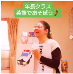
tokumochikg 2025.11.27 (木) 🚗✈️🚂 年長クラス「英語であそぼう」 年中クラスさんは動物編でしたが、こちら年長クラスさんは「乗り物」編でのレッスンをしました👏