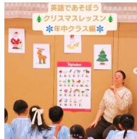
tokumochikg 2025.12.11 (木) 🎄👉👈 英語であそぼう〜クリスマスレッスン 🎄〜年中クラス編 🎄 年中クラスの保護者の方々の見学日でもありました👏 クリスマスにちなんだ絵カードを用いてのレッスンでした👏