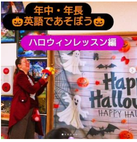
tokumochikg 2025.10.30 (木) 🎃👻🦇 年中・年長クラスさん 英語であそぼう〜ハロウィンレッスン編