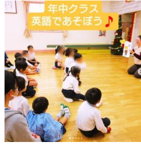
tokumochikg 2025.11.27 (木) 🐶🐱🐭 年中クラス「英語であそぼう」 英語で覚えよう〜動物編 🐾 動物の絵カードを提示されながら、動物名を英語で〜発展して英語で発音された動物名と、絵カードに描かれた動物名が合っているかの Yes or No