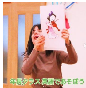
tokumochikg 2026.01.15 (木) 🎄👉👈 年長クラス 英語であそぼう 🎵〜外国人講師が交代しました👏 テーマはいつも通り英語で挨拶〜英語の楽曲に合わせて身体を動かし〜英語でのカウント〜講師がカラーカードを示し、示されたカラーをホール内から探してタッチ👏 英語でカラーを憶える👉👉👉👉 Sleep・Wash・Eat・Go To School・Play Violin〜ダルマさんが転んだの英語バージョン〜英語ジャンケン