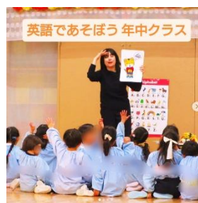
tokumochikg 2026.01.22 (木) 🎵👉👈 年中クラス〜英語であそぼう 🎵 英語でご挨拶〜今の気持ちを英語で表すと...Happy・sad・Angry・Hungry・Sleepy etc..... A B C アルファベットをジェスチャーと発音〜A B C SONG〜アルファベットカードを使って誰が持っているかを当てるゲーム イングリッシュジャンケンをしました👏