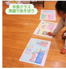
tokumochikg 2025.11.06 (木) 🏠👉👈 年長クラス「英語であそぼう」 アルファベットカードを使ってA B C...の順番に、並べました 本日のお題は R O O M ~LIVING 'リビング'・KITCHEN キッチン・BED ベッド・BATH バス をカードを使ってYES NO クイズにして学びました👍