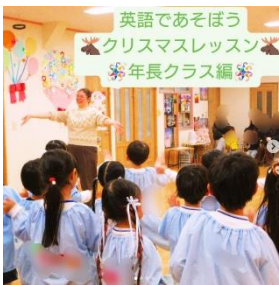
tokumochikg 2025.12.11 (木) 🎄👉👈 英語であそぼう〜年長クラス編〜クリスマスレッスン👏 外国人講師の先生から『MerryXmas🎄』の声かけとサンタクロースのプレゼント👉クリスマスにちなんだ絵カードでのレッスンでした👏 年長クラスの保護者の方々の見学日でもありました👏